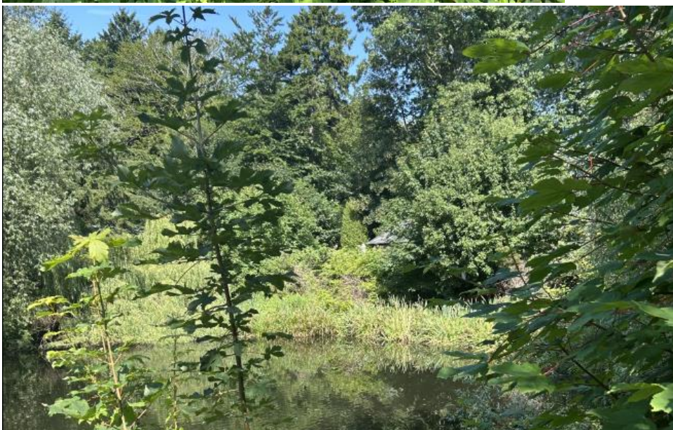
Figur 5: Foto taget fra den sydøstlige og sydlige del af matriklen.