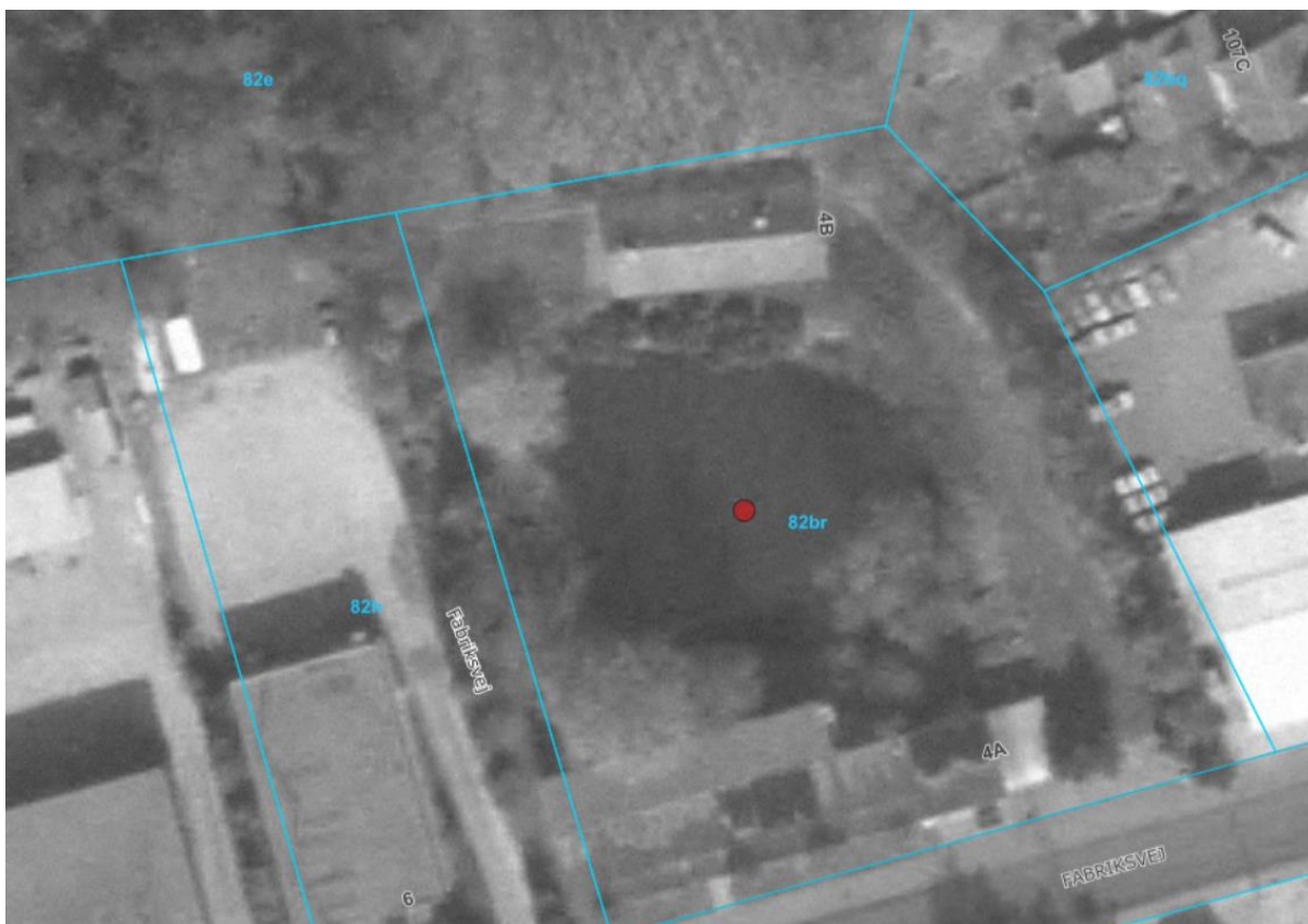
Figur 1: Luftfoto fra 1989