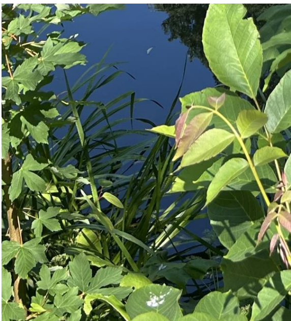
Figur 3: Den sydlige del af søen.

Vi kan erkende lidt gul iris på den sydlige del af søbredden. ↓