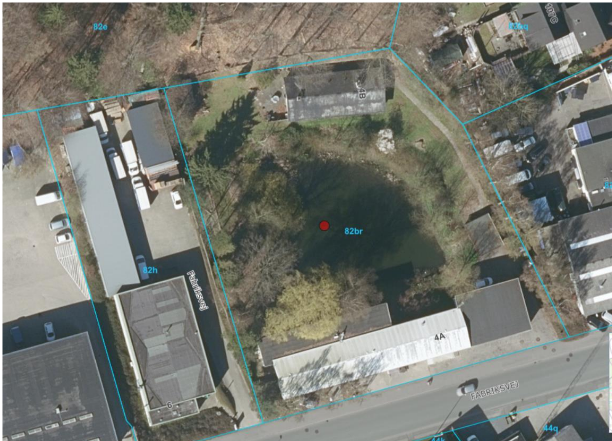
Figur 3: Luftfoto fra 2019

Skriv sikkert til Helsingør Kommune via digital post