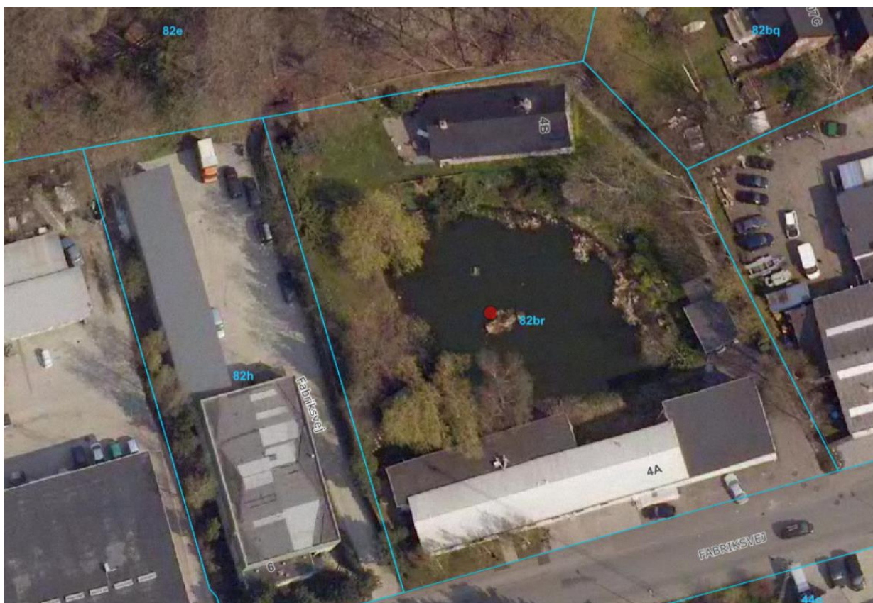
Figur 2: Luftfoto fra 2006